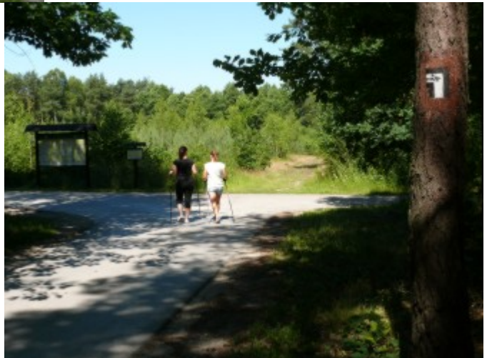
Trasy do Nordic Walking na terenie gminy Kluczewsko